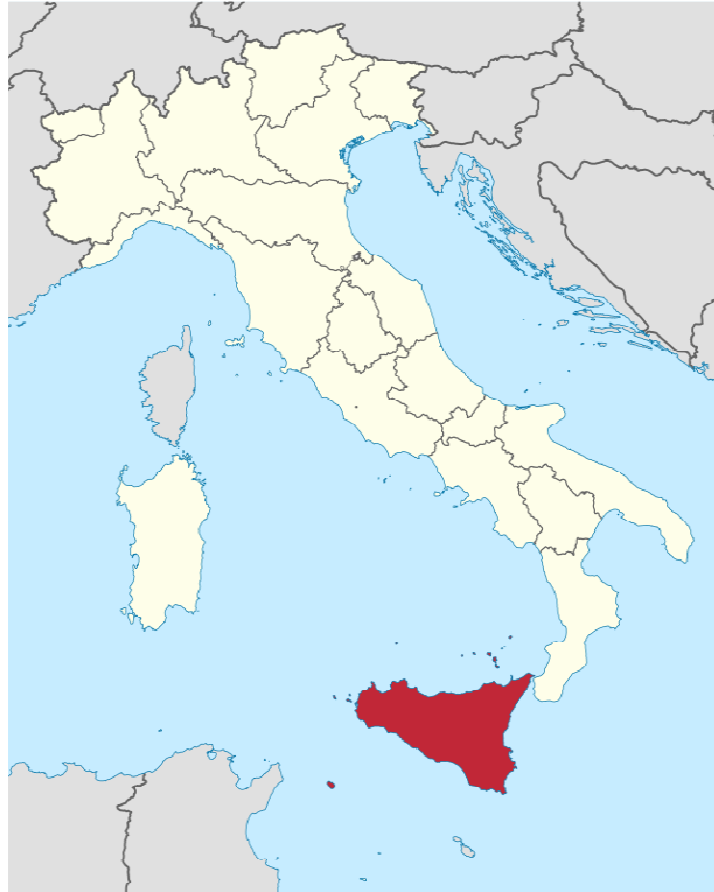
La Sicile au sud de l'Italie